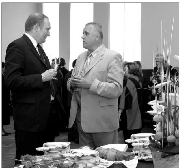
Hetk linnapea vastuvõtult.