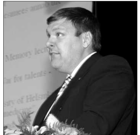
Tervitussõnavõtuga esines sotsiaalmi- nister Marko Pomerants.