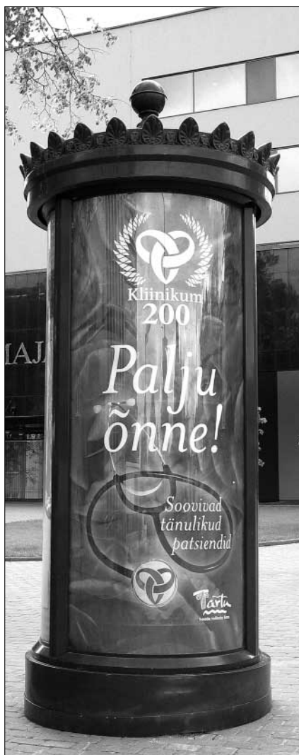
Juubelingitusena Tartu linnavalitsuselt oli kesklinn kaunistatud suurte õnnesooviplakatitega.