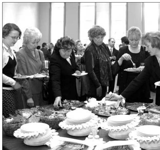
AS Frens oli katnud isuäratava suupistelaua.