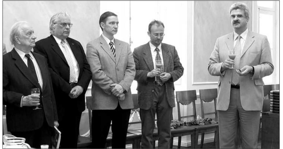
Tänu sõnad Urmas Siigurilt kõigile neile, kes raamatu valmimisele kaasa aitasid.