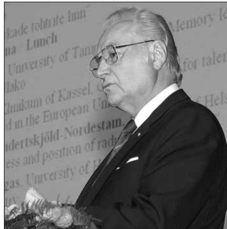
Konverentsi avas Vabariigi President Arnold Rüütel.