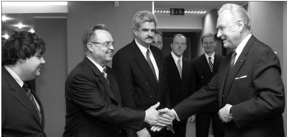
Konverentsile saabub kliinikumi juubeliürituste patroon, Eesti Vabariigi President hr Arnold Rüütel.