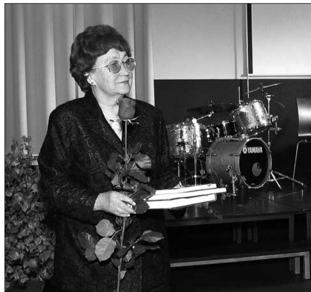
...ja Erna Bostonile.