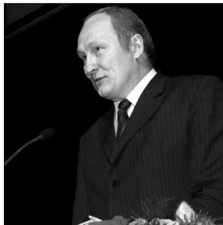
Tartu Ülikooli rektor Jaak Aaviksoo tervituskõnet pidamas.