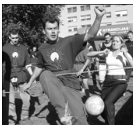
Jalgpalli võistluse võitis EMO.