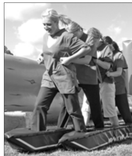
Erakorralise kardioloogia osakonna esindus suusatamisega teatevõistlust lõpetamas.