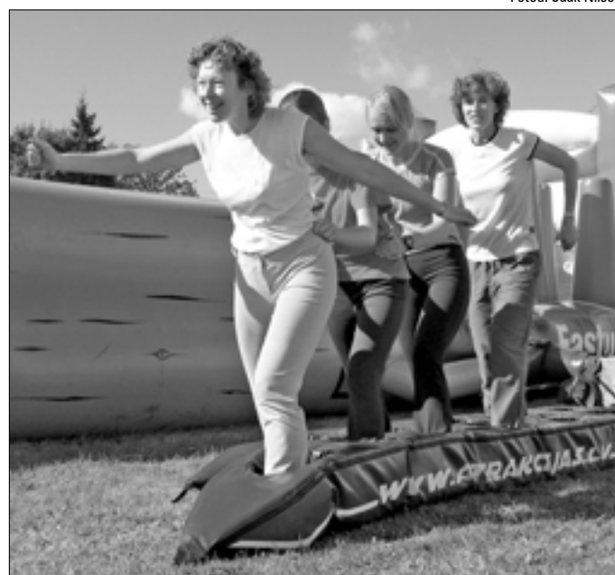
Lastekliiniku võistkond teatevõistluses finišisse suusatamas.