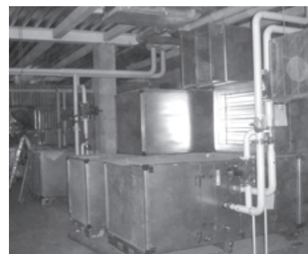
Uue maja „sisikond“: ventilatsioonikamber G2 korpuses.