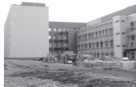
G1 korpus L. Puusepa tänava poolt vaadatuna.