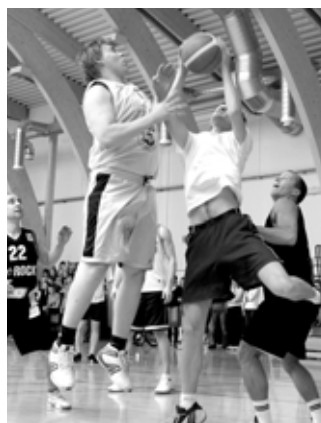
Tuline heitlus korvi all.