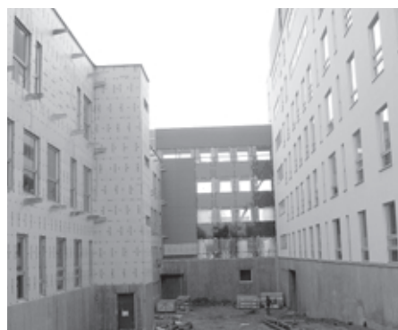
Vaade G1 ja H korpuste ühendusgaleriile N. Lunini tänava poolt.