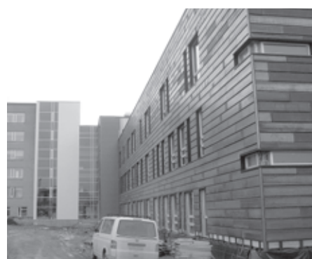
Vaade G1 ja A korpustele N. Lunini tänava poolt.