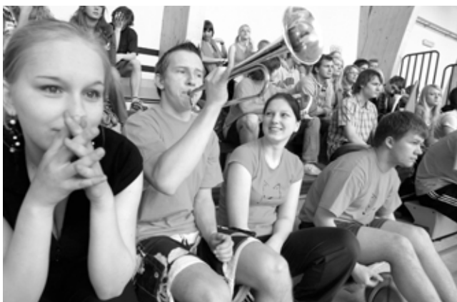
HETKI TURNIIRILT: Rebaste fännklubi mängule kaasa elamas.