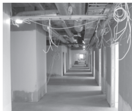
Koridor G2 korpuses, laes on näha elektrikaablid ning ventilatsioonitorud.