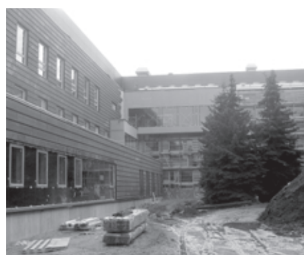
Naistekliiniku tagantvaade siseõuelt