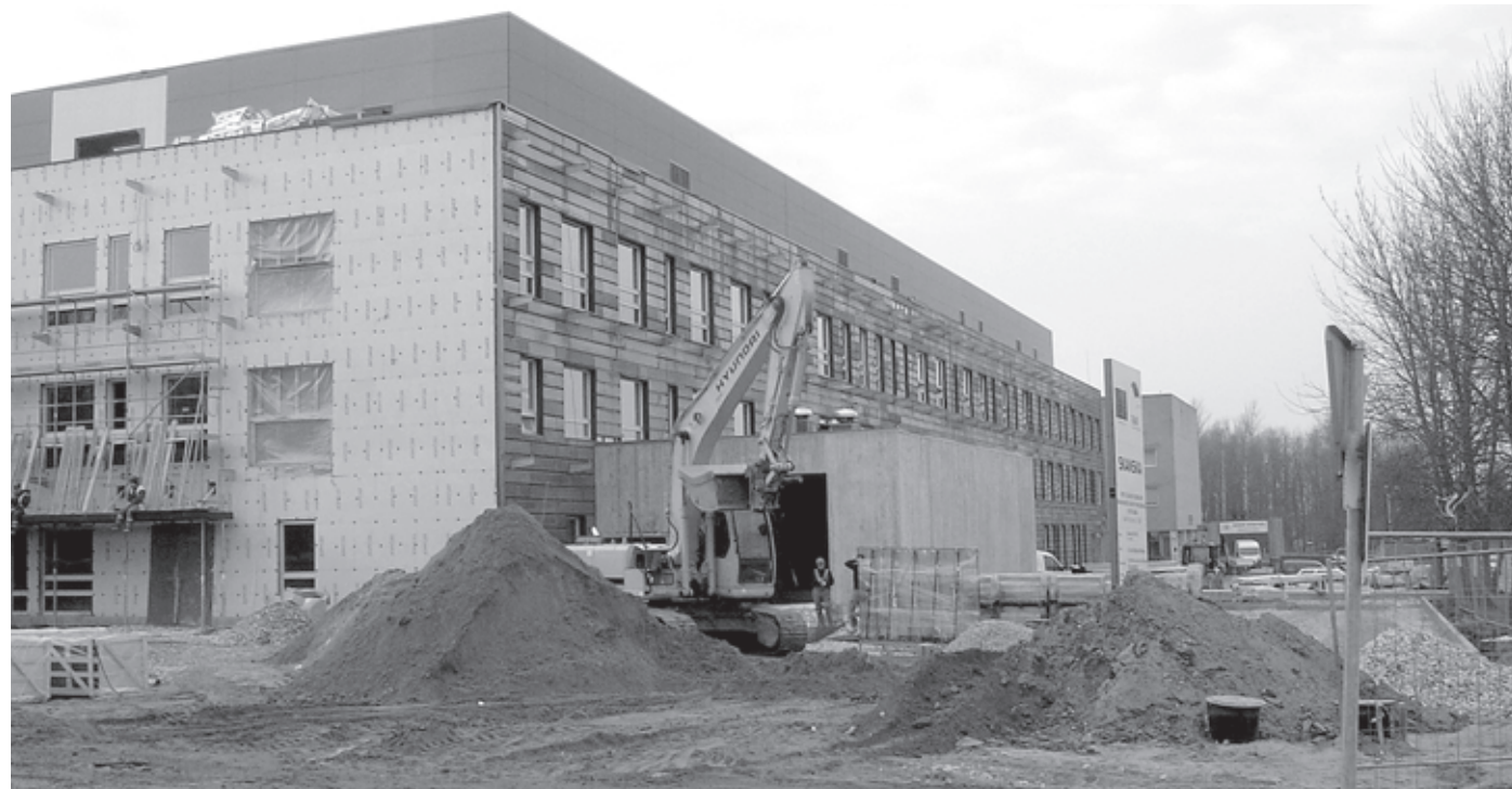
Tulevane naistekliiniku hoone L. Puusepa tänava poolt vaadatuna, esiplaanil kiirabi sissepääs uude EMO-sse.