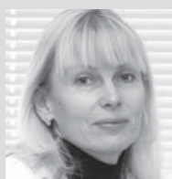
EVE UNT Spordimeditsiini ja taastusravi kliiniku vanemarst-õppejõud