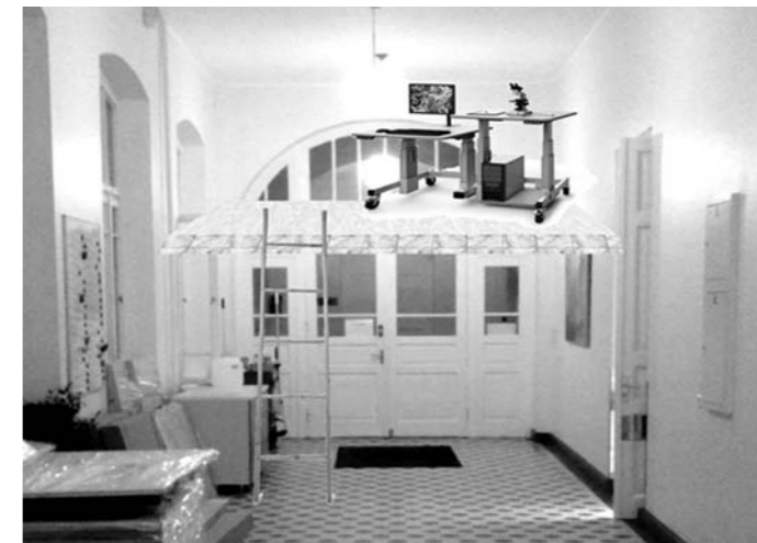
Selline näeb peatselt välja geneetikakeskuse teise korruse koridor, kuhu lae alla on ehitatud uus tsütogeneetiku töökoht vajaliku mikroskoobi ja arvutiga. Nagu ka pildilt näha, on ehitus juba alanud.

Kus aga häda kõige suu- rem, seal abi kõige lähem. Nii tuldigi mõttele, et töökohti saab kergesti juurde tekitada, kui ära kasutada vana maja kõrgeid ruume ning viia uute töötajate lauad, mikroskoobid ja muud seadmed sõna otse- ses mõttes lae alla. Ruumi