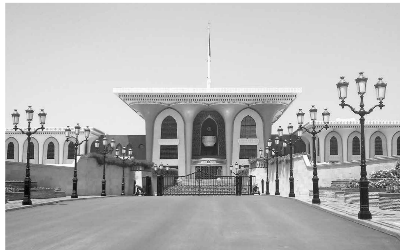
Juhatus administratiivhoone Lõuna-Eestis

Seoses haiglate võrgustumisega ja regionaalpoliitika heade tavade järgimisega on kliinikumi juhatus teinud otsuse laieneda lõuna poole. Et luua uusi töökohti, on plaani võetud ka Lõuna-Eestis asuvate haiglate hoonete rekonstrueerimine. Esimene hoone, juhatuse uus administratiivhoone, on lehe trükki mineku ajaks juba valmis. Hoone on kõige lõunapoolsem.