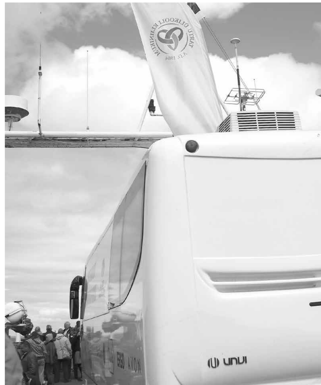
Kliinikumi lipuga mammograafiabuss teel põhja Lindaliini parvlaeval

VKL-470 Muu tänuavalduse üleandmise vorm