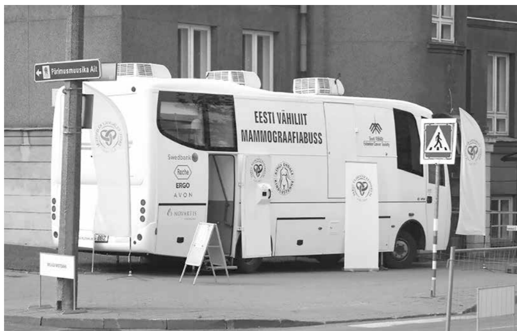
Mammograafiabuss Viljandis Mulgi Messil, kus esmakordselt teostati bussis ka pangandustoiminguid. Rahavaru automaadi tarvis hoitakse bussi all paiknevates hoiulaegastes.

Kuna täiendavate kontrollide ehitamine rakendusesse on väga kallis, siis paigaldatakse kõikidele kasutajatele lihtsalt uued elektrikarjusega klaviatuurid. Mittekorreksete andmete sisestamise korral annab klaviatuur kasutajale kerge elektrilöögi.